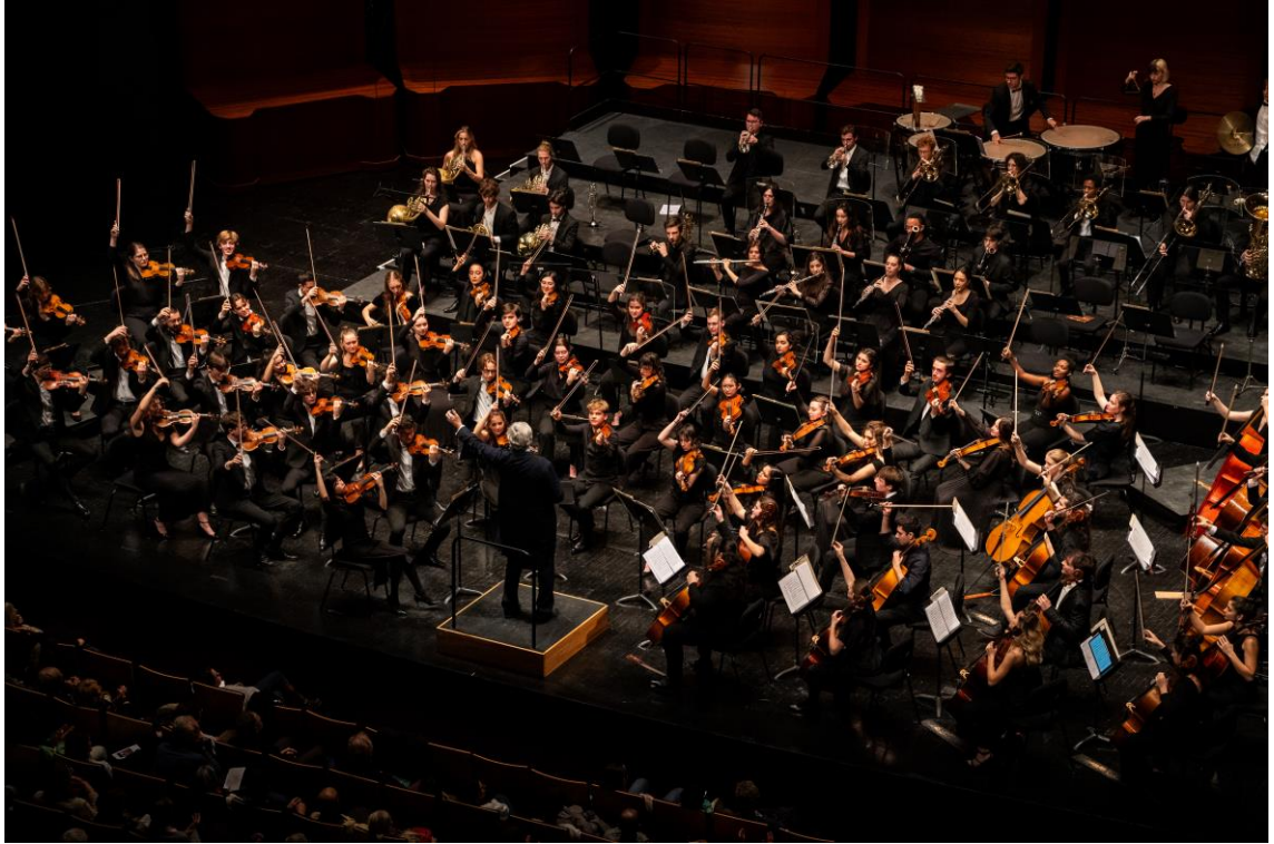
Concert de l'Orchestre Français des Jeunes à l'Auditorium de l'Opéra de Dijon, le 4 décembre 2023.

L'Orchestre Français des Jeunes a également entamé une résidence en 2023 à l'Opéra de Dijon, qui est divisée en deux sessions (été et automne) à la Saline royale d'Arc-et-Senans et en une session (hiver) à l'Opéra de Dijon. Cette collaboration se prolonge depuis de saison en saison, et permet d'avoir une présence régulière de l'Orchestre au cœur de la programmation de l'Opéra. Ce rapprochement a pour objectif tant d'accompagner l'OFJ dans ses résidences artistiques, que de former les musiciens aux actions de médiation au service de tous les publics.