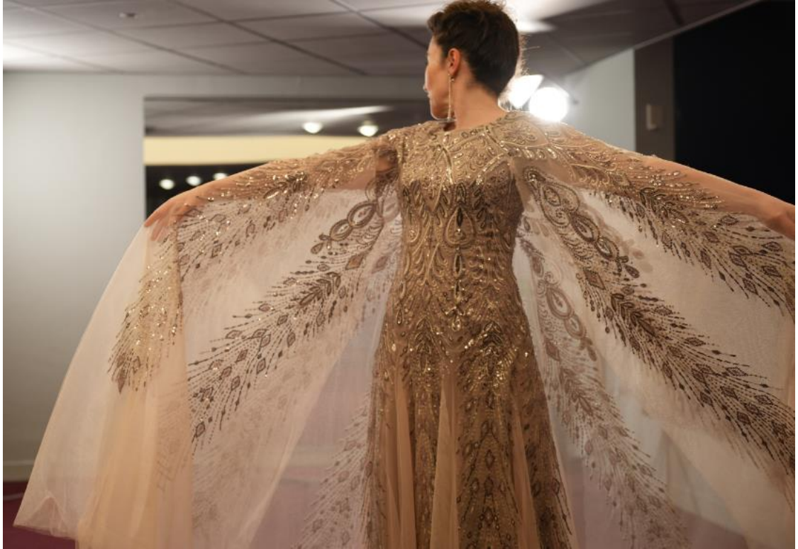
Différentes étapes de la vie des costumes à l'Opéra de Dijon.

En amont des répétitions, les maquilleurs et les coiffeurs conçoivent le maquillage, les coiffures et éventuellement les perruques des personnages selon les indications du metteur en scène. Avant la représentation, ils aident les artistes à se préparer.