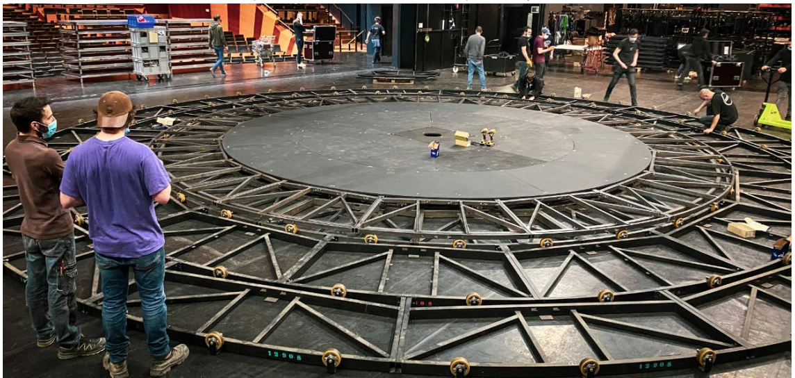
Montage du décor de l'opéra Don Pasquale au plateau de l'Auditorium, saison 21-22.