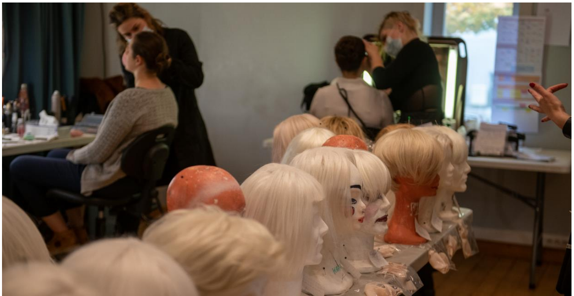
Studio de maquillage avant une représentation de l'opéra Macbeth , saison 21-22.

En amont des répétitions, les maquilleurs et les coiffeurs conçoivent le maquillage, les coiffures et éventuellement les perruques des personnages selon les indications du metteur en scène. Avant la représentation, ils aident les artistes à se préparer.