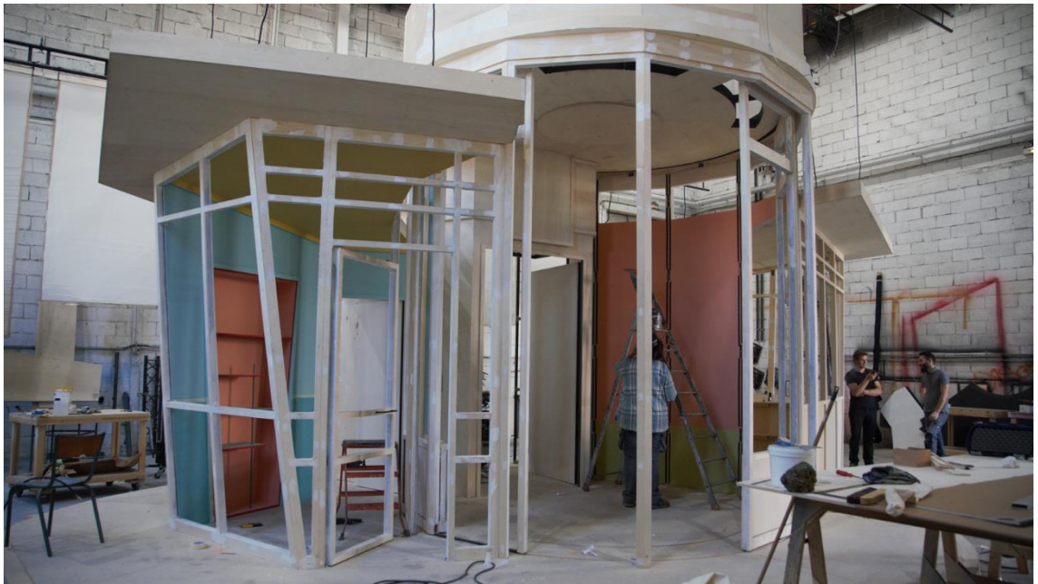
Construction du décor de La Petite Boutique des horreurs aux Ateliers de l'Opéra de Dijon, saison 22-23.

Les techniciens constructeurs et les décorateurs se mettent au travail plusieurs mois avant le début des répétitions pour construire le décor voulu par le metteur en scène. Autrefois, on utilisait exclusivement des toiles peintes, tandis qu'aujourd'hui, la grande majorité des décors sont en 3D. Dans le spectacle vivant, on utilise beaucoup d'effets pour donner l'illusion du vrai, ainsi les décors sont réalisés avec du bois, du polystyrène ou des armatures en métal, et utilisent des jeux de peinture pour augmenter le réalisme (faux marbre, parquet, mur en briques...). Les accessoiristes , quant à eux, sont chargés d'acheter ou de fabriquer tous les accessoires nécessaires pour le spectacle : chaises, théières, chapeaux, masques, etc. Ils permettent de donner vie à la scène.