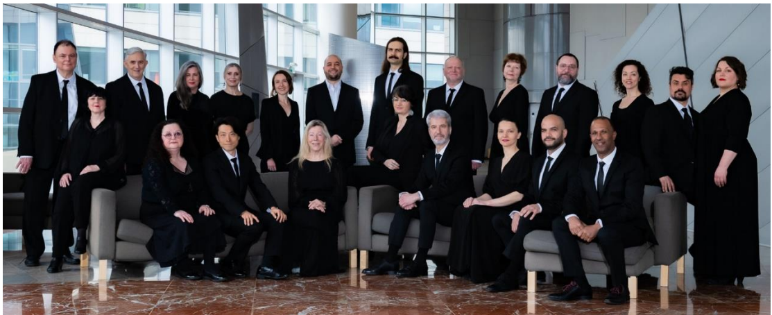
Artistes du Chœur de l'Opéra de Dijon.

Les choristes sont des chanteurs, hommes et femmes, qui travaillent à l'intérieur de l'Opéra de Dijon de manière permanente. Ils chantent toujours ensemble et forment le chœur, présent dans un grand nombre d'opéras. Leur travail les conduit souvent à chanter dans des langues étrangères. Le Chœur de l'Opéra de Dijon compte 23 choristes, un chef de chœur , une régisseuse des chœurs et un pianiste .