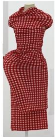
Pygmalion – Rameau, Photos d'inspiration pour Vénus Créatrice costumes : Sonia de Sousa