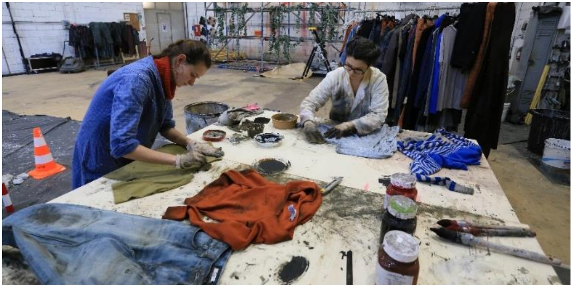
Travail de teinture, patinage, sur des costumes.

À l'Opéra de Dijon, l'atelier costume est géré par une équipe permanente composée de la cheffe des ateliers couture et d'une costumière. Cette dernière réalise des créations de costumes à partir de maquettes et doit s'adapter à des silhouettes particulières en prenant en compte tout ce qui relève du bien-être de l'artiste lorsqu'il est sur scène. Le métier de costumière diffère de celui de la simple couturière qui coud un vêtement selon des tailles sans s'adapter à une silhouette particulière. Contrairement aux grandes maisons d'Opéra dans lesquelles chaque personne est employée pour un travail très spécifique, les costumières de l'Opéra de Dijon sont polyvalentes. En plus des deux costumières permanentes, des intermittentes sont appelées selon les besoins pour faire partie de l'équipe. Ces costumières ont des compétences solides en couture qui leur permettent de s'adapter à toutes les créations mais leurs savoir-faire et leurs spécialités sont différentes de sorte qu'elles peuvent se répartir au mieux les travaux techniques à effectuer. Pour donner quelques exemples, une des costumières de l'Opéra de Dijon est spécialisée dans la confection de tailleurs hommes, d'autres dans la chapellerie (la fabrication de chapeaux), la corsetterie ou encore dans la teinturerie.