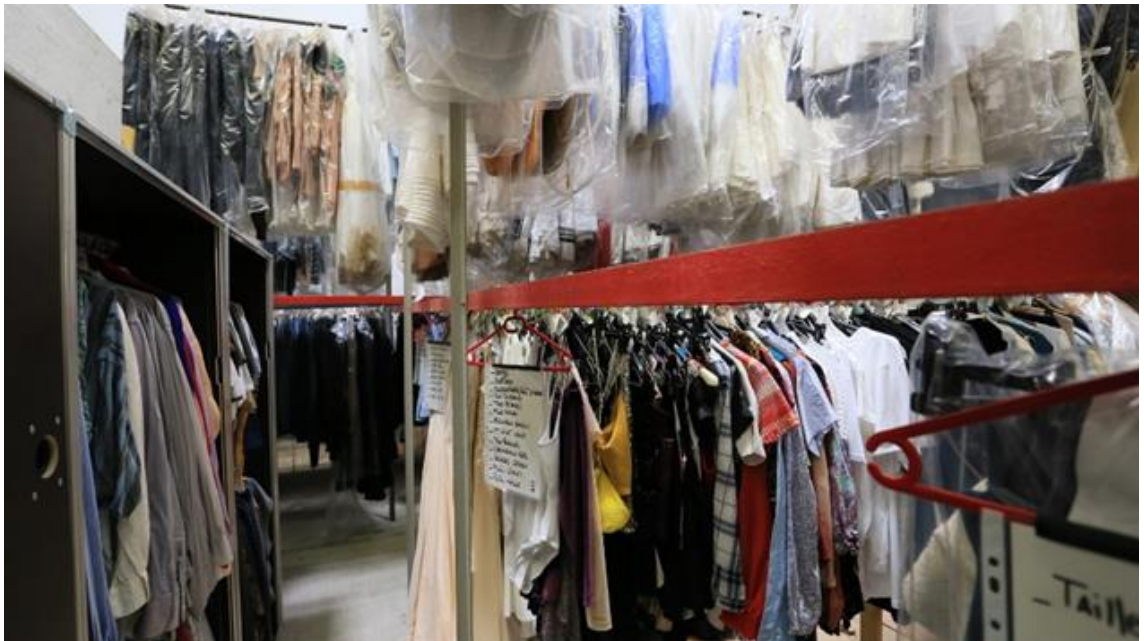
Les costumes sont d'abord stockés dans les ateliers de l'Opéra de Dijon.

En ce qui concerne l'archivage des costumes, des critères de sélection et de conservation des costumes ont été établis. Tous les costumes ne présentent pas assez d'intérêt pour être archivés. Seules les pièces exceptionnelles (renommées de l'interprète, du créateur costumes, du metteur en scène et les techniques employées par exemple) sont conservées. Le CNCS (centre national du costume de scène) a d'ailleurs pour mission la conservation de ces pièces. D'autre part, la question de l'impact écologique de la production des costumes est au cœur des réflexions de tous les ateliers. Des réflexions sont actuellement menées sur le recyclage et le réemploi des éléments de costumes ne présentant pas ces critères d'exception.