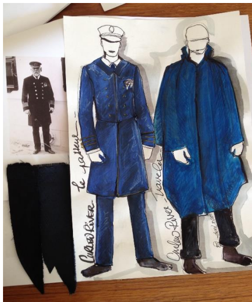
Curlew River - Britten, Croquis des marins Créatrice costumes : Fanny Brouste