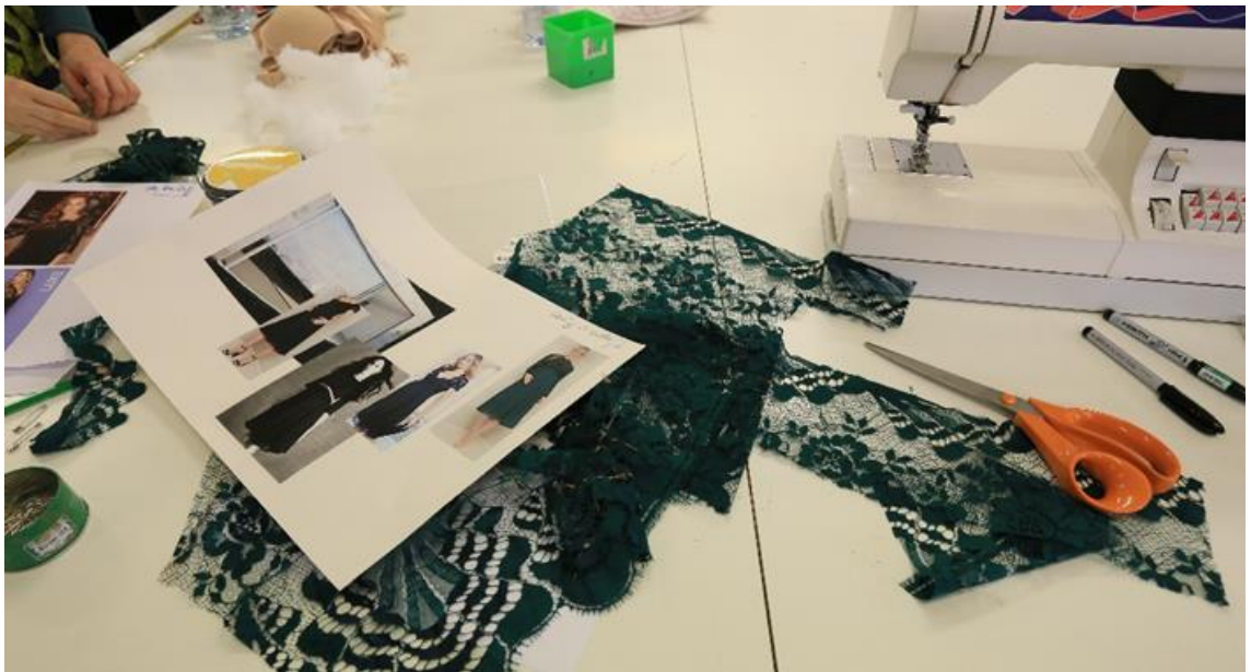
Les costumières choisissent les tissus d'après les maquettes des costumes.

Une fois terminées, les maquettes sont transmises aux ateliers et les matières premières peuvent être achetées. La cheffe costumière a une mission de mise en œuvre des moyens techniques et humains nécessaires à la fabrication de la production. En concertation avec le créateur costume, elle choisit les tissus en procédant par échantillonnage. Le choix des matières et des couleurs répond à la fois aux désirs du créateur costume qui les a pensées en lien avec la mise en scène et les lumières, mais il répond également aux moyens techniques les plus adaptés. Il s'agit d'imaginer l'ambiance visuelle recherchée pour une création particulière.