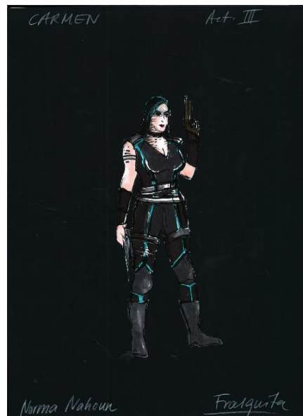
Carmen – Bizet, Croquis de Carmen, Acte III Créatrice costumes : Adriane Westerbarkey