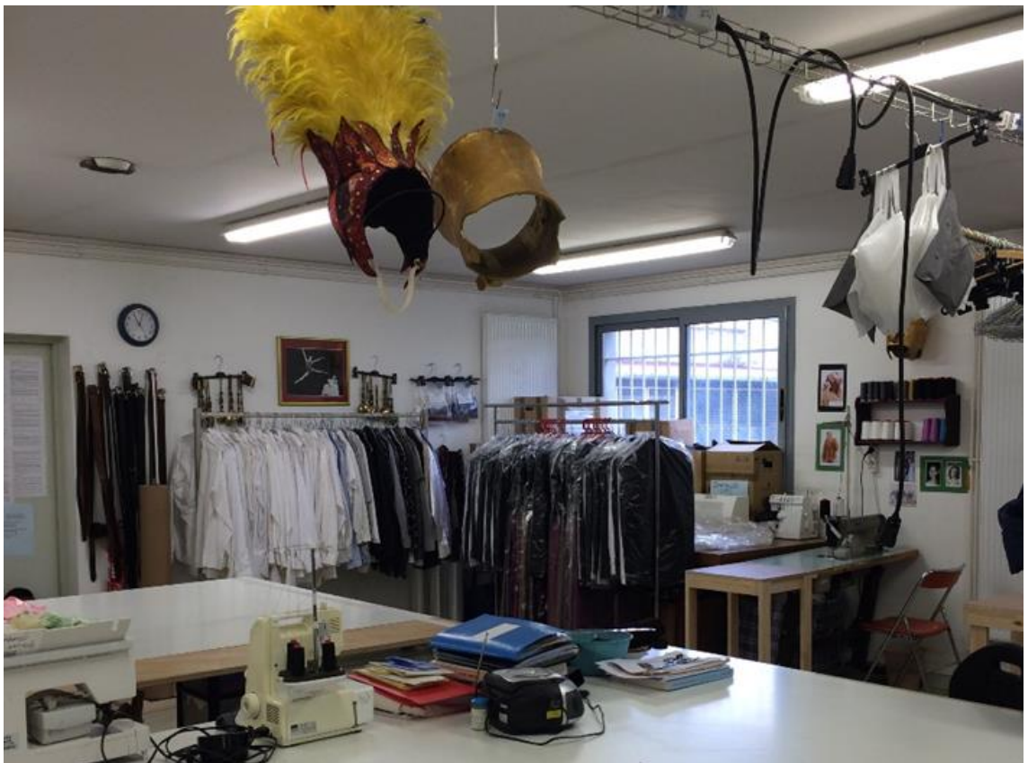
Les ateliers des costumes de l'Opéra de Dijon.

Les chanteurs peuvent avoir un avis sur les costumes jusqu'à une certaine limite. Les demandes concernant le bien-être pour jouer ou chanter doivent être entendues par la cheffe costumière pour adapter au mieux le costume techniquement. En effet, dans un opéra, les chanteurs sont aussi comédiens et le costume ne doit donc pas les empêcher de bouger sur scène ni être trop serré pour ne pas gêner leur souffle. Quant à l'acceptation de demandes d'ordre esthétique ou artistique, elle est à la discrétion du créateur costume et du metteur en scène.