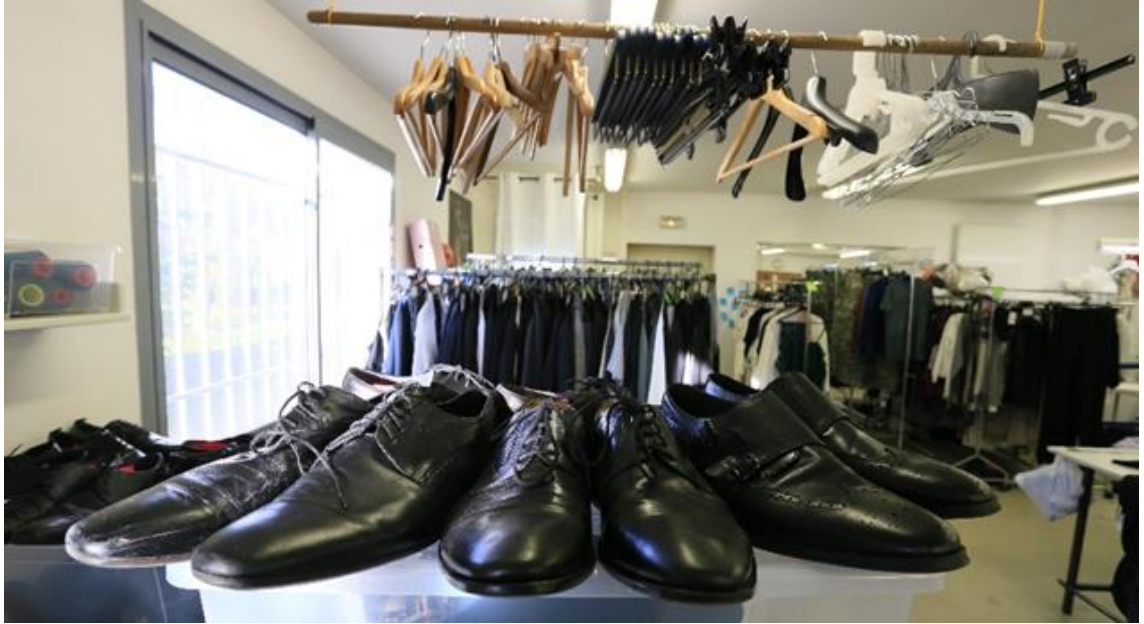
Le stockage des costumes hommes.