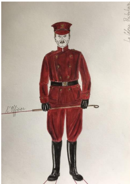
Les Châtiments – Brice Pauset, Croquis de l'officier Créatrice costumes : Mariane Delayre

À partir des premières réflexions et de l'étude du livret, le créateur costume propose les maquettes qui peuvent prendre différentes formes comme des dessins ou des photographies d'inspiration avec parfois des chutes de tissus pour donner une première idée des matières.