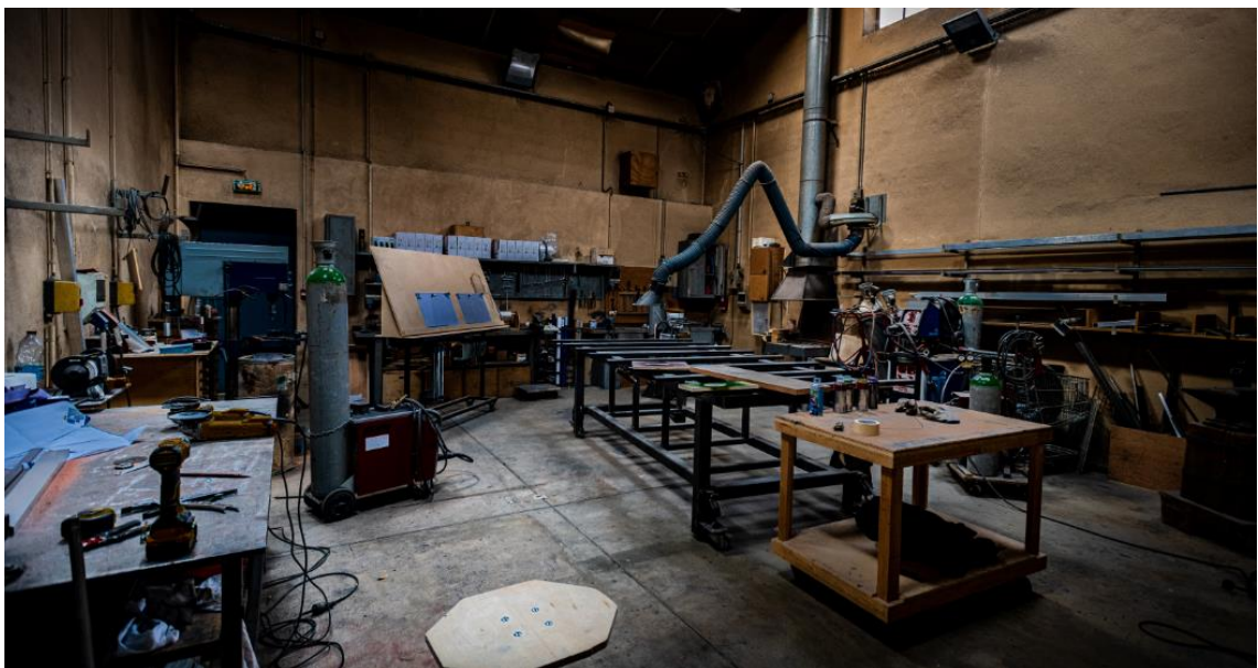
Serrurerie des Ateliers de l'Opéra de Dijon.