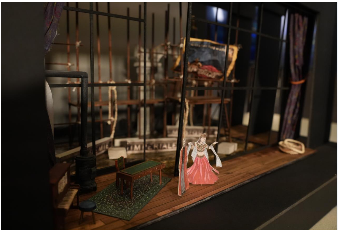
Maquette réalisée par l'équipe artistique pour l'opéra Les Pêcheurs de perles de Bizet, saison 24-25.

Le metteur en scène est la clé de voûte de la création. Il dirige le jeu d'acteur des chanteurs et définit la vision de l'œuvre représentée avec l'aide d'une équipe de créateurs choisis pour répondre à cette démarche artistique. En effet, le metteur en scène est souvent assisté par un décorateur de théâtre ou scénographe chargé de l'aménagement de l'espace scénique. Celui-ci est une sorte d'hybride d'artiste peintre possédant l'instinct du théâtre, de sculpteur, d'architecte et d'artisan d'art. À partir des années 50, l'évolution technologique des matériels d'éclairage de scène rendent nécessaire la présence d'un éclairagiste , créateur des lumières qui exhaussent ou atténuent l'architecture et la couleur de chaque tableau en phase avec le rythme et l'espace de la mise en scène. En parallèle, le costumier affirme visuellement le tempérament de chaque personnage et aide le comédien à exprimer l'émotion de son texte. Toutes ces fonctions créatives peuvent être partiellement cumulées par une seule personne, selon la taille des structures de production.