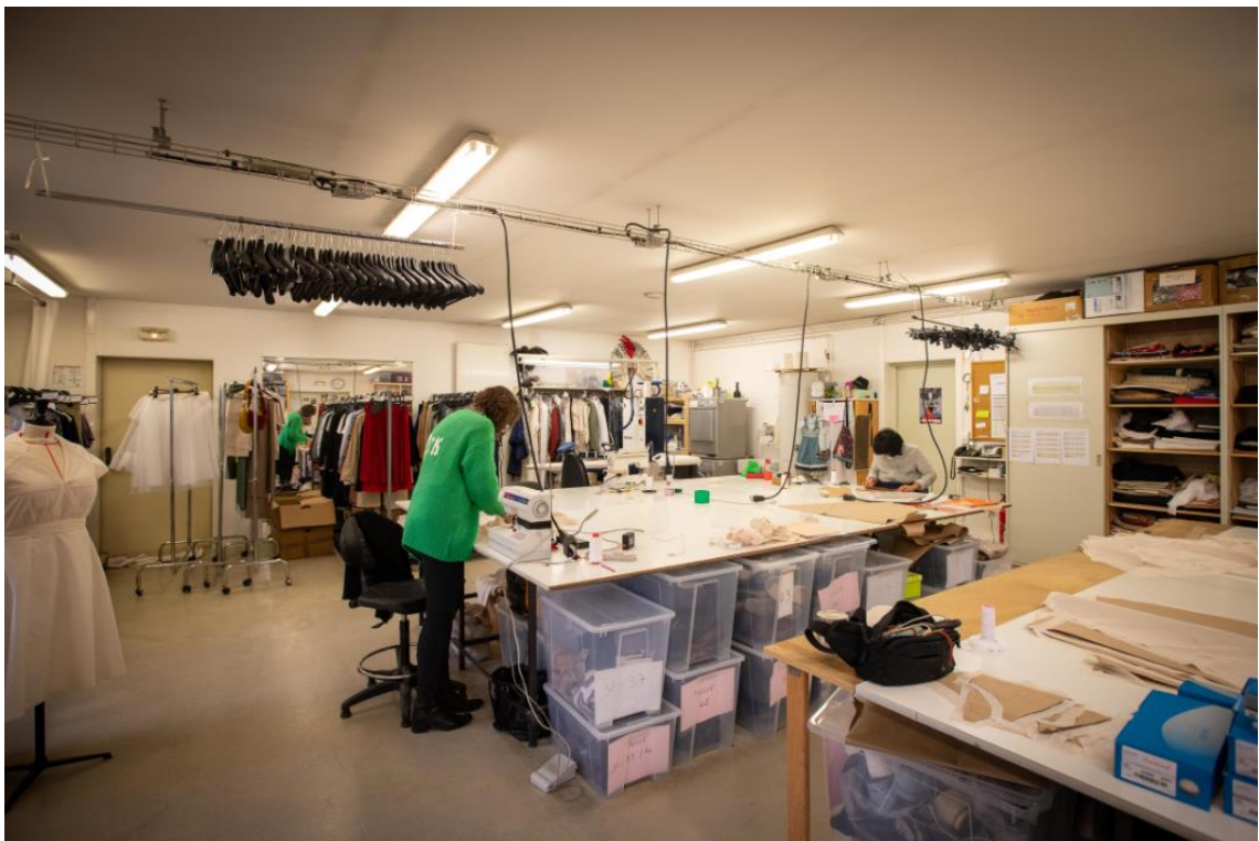
Ateliers de l'Opéra de Dijon en activité.