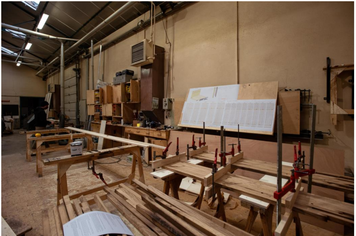
Menuiserie des Ateliers de l'Opéra de Dijon.