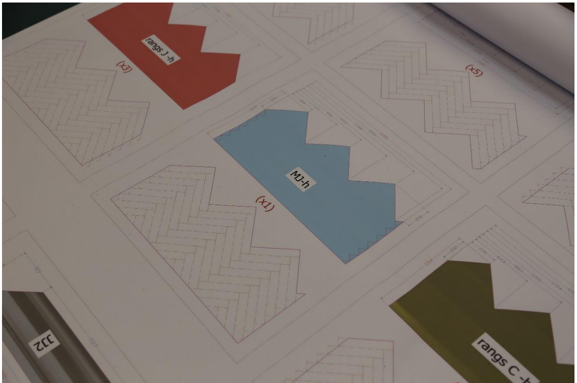
Plan de décor en 2D.

C'est le choix des méthodes et des moyens de mise en œuvre des images voulues par le scénographe . Celui-ci pouvant être de formation artistique diverse - architecte, designer, plasticien, illustrateur, vidéaste – ne possède pas forcément toutes les connaissances et les expériences des contraintes liées à l'environnement de la scène. En réponse, beaucoup de machinistes-constructeurs rompus aux années d'exercices de montages, mises en place de décors, mais aussi transports et stockages, possèdent la culture et l'expérience nécessaires pour concevoir les décors afin de les rendre compatibles avec toutes les contraintes de réactivité et d'économie de moyens. Dans les grands ateliers, la conception est parfois relayée par des bureaux d'étude spécialisés qui établissent les stratégies de fabrication en fonction des moyens alloués à la production. Ils réalisent les plans de construction en fonction d'une maquette fournie par le scénographe, traditionnellement à l'échelle 1/33 e (3 cm pour 1m) ou au 25 e (4 cm pour 1m). Cette phase de conception peut prendre entre deux et quatre mois pendant lesquels les différentes possibilités sont envisagées.