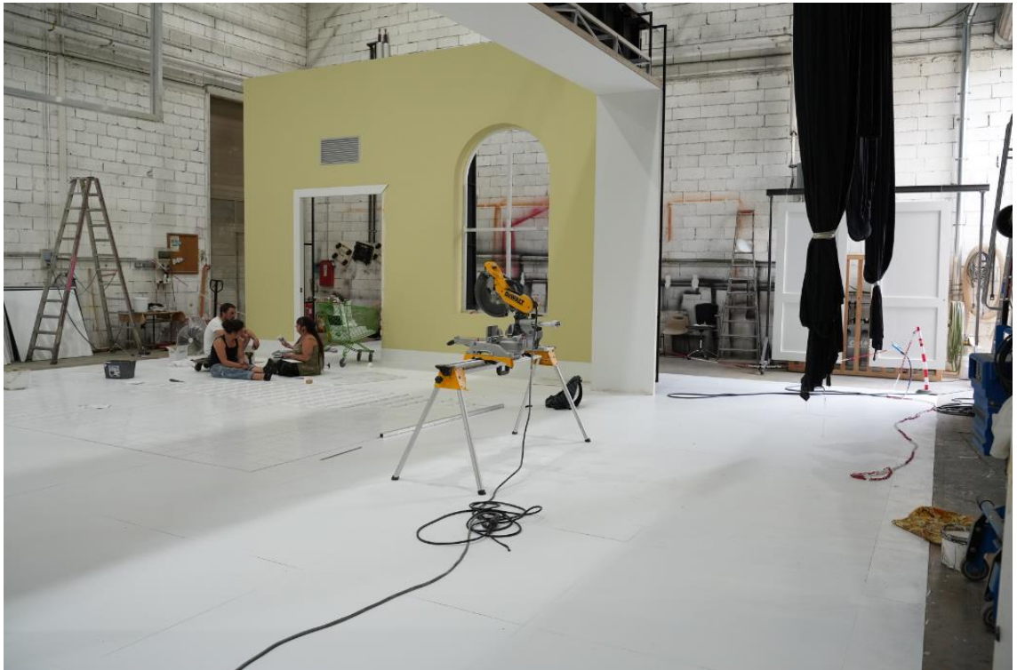
Construction du décor de l'opéra L'Autre voyage de Schubert, saison 23-24.

Le métier d' artisan de construction de la scène nécessite une très grande capacité mentale pour organiser l'espace dans ses trois dimensions, une bonne connaissance des métiers de la scène et des facultés d'autonomie et d'adaptation aux différentes demandes des créateurs. Il sait également travailler en équipe disciplinée pour les missions de machinerie qui exigent coordination, rapidité et efficacité. C'est aujourd'hui le profil de la plupart des salariés permanents des ateliers de l'Opéra. À Dijon la moyenne de durée d'une réalisation de décors est de deux mois. Selon le volume des décors, l'équipe est renforcée par des contrats à durée déterminée et les précieux intermittents du spectacle qui disposent pour la plupart de l'expérience de la scène requise dans le métier.