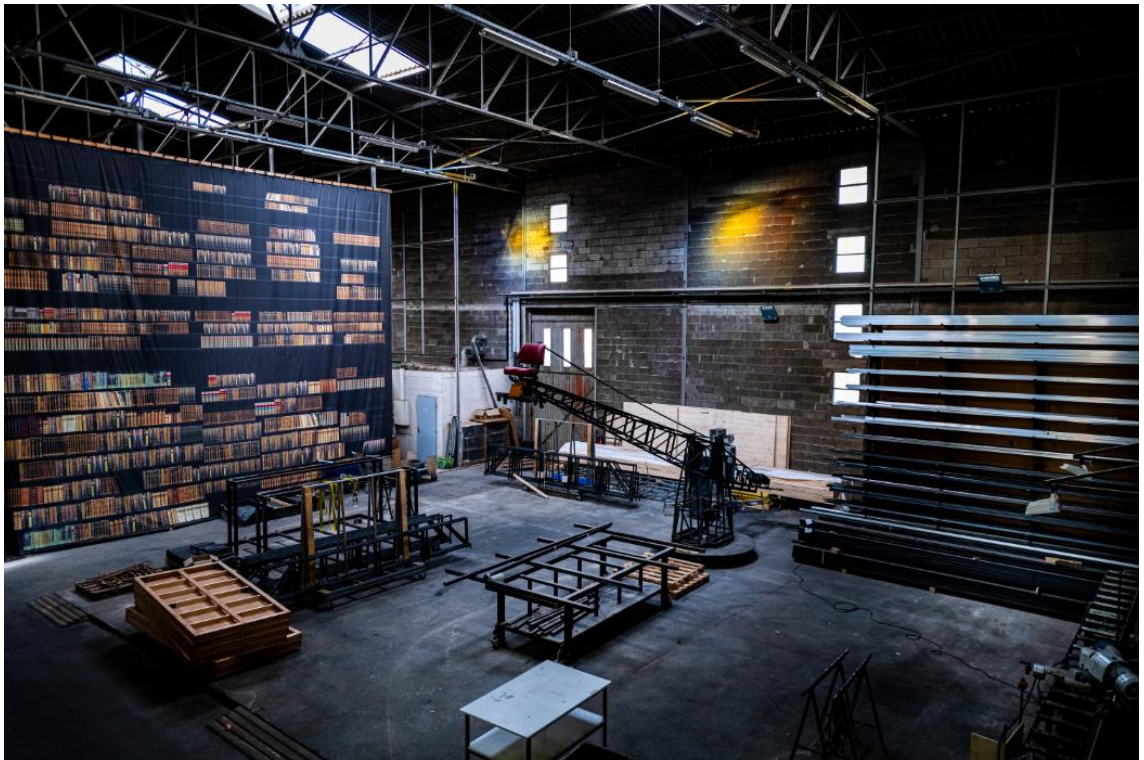
Dépôt des Ateliers de l'Opéra de Dijon.